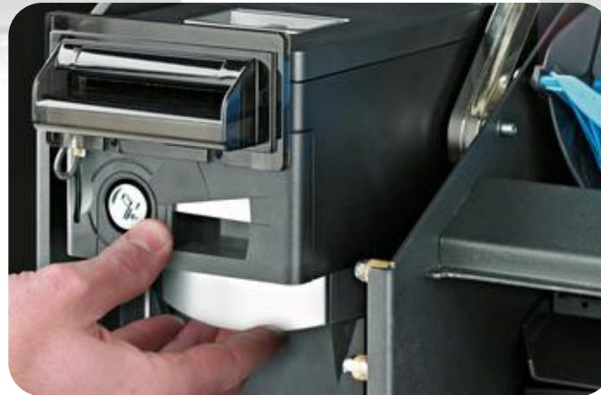
Casse chiuse e intercambiabili