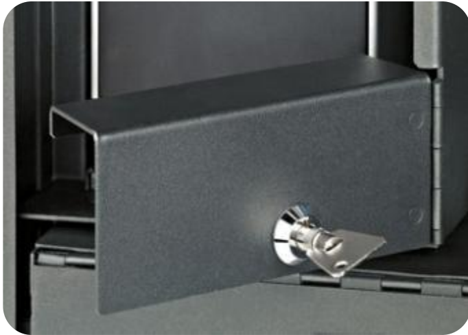
Blocco di sicurezza